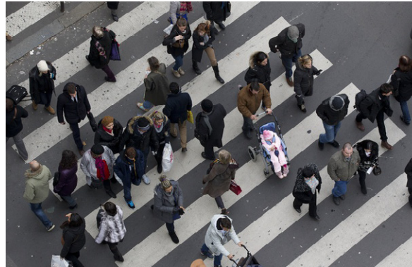
Des personnes circulent à Paris (illustration).