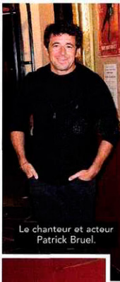
Le chanteur et acteur Patrick Bruel.